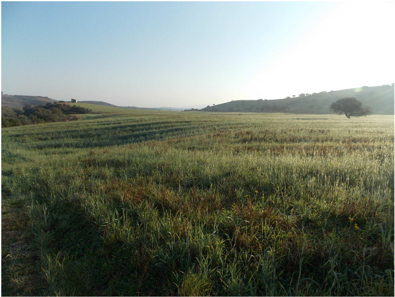
Tavola n. 1.1 Habitat di interesse comunitario